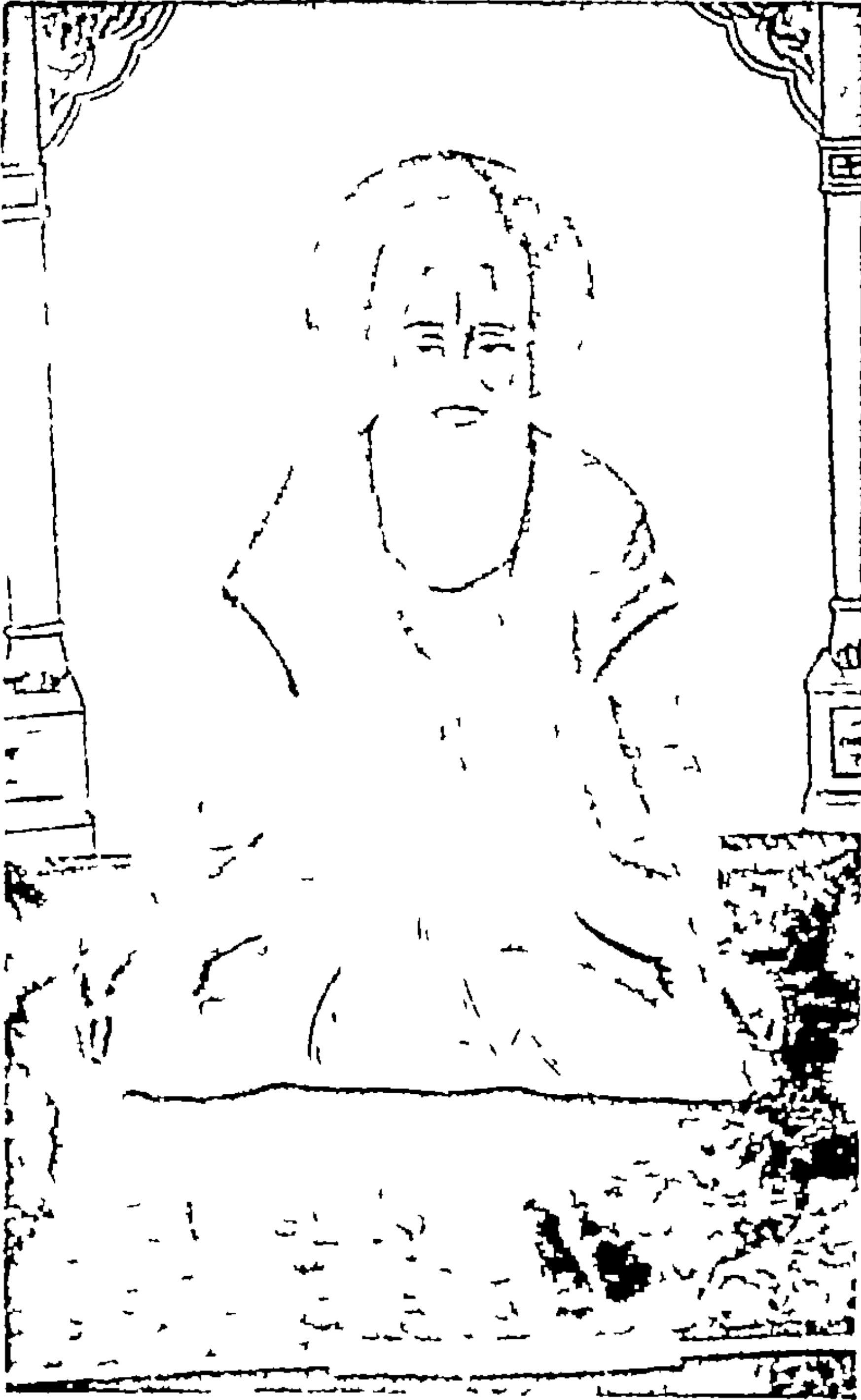
सत रवि माहव